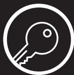
ACCÈS ET ADMINISTRATION RÉSEAU