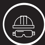
ARCHITECTURE ET INSTALLATION RÉSEAU