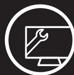
SERVICE DE MAINTENANCE