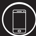
COUPLAGE TÉLÉPHONIE ET INFORMATIQUE