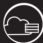
STOCKAGE ET SAUVEGARDE